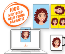
Foto wordt besteld op fotopapier, fotocadeau of als digitaal bestand

Ouders kiezen zelf hun favoriete achtergrond(en)